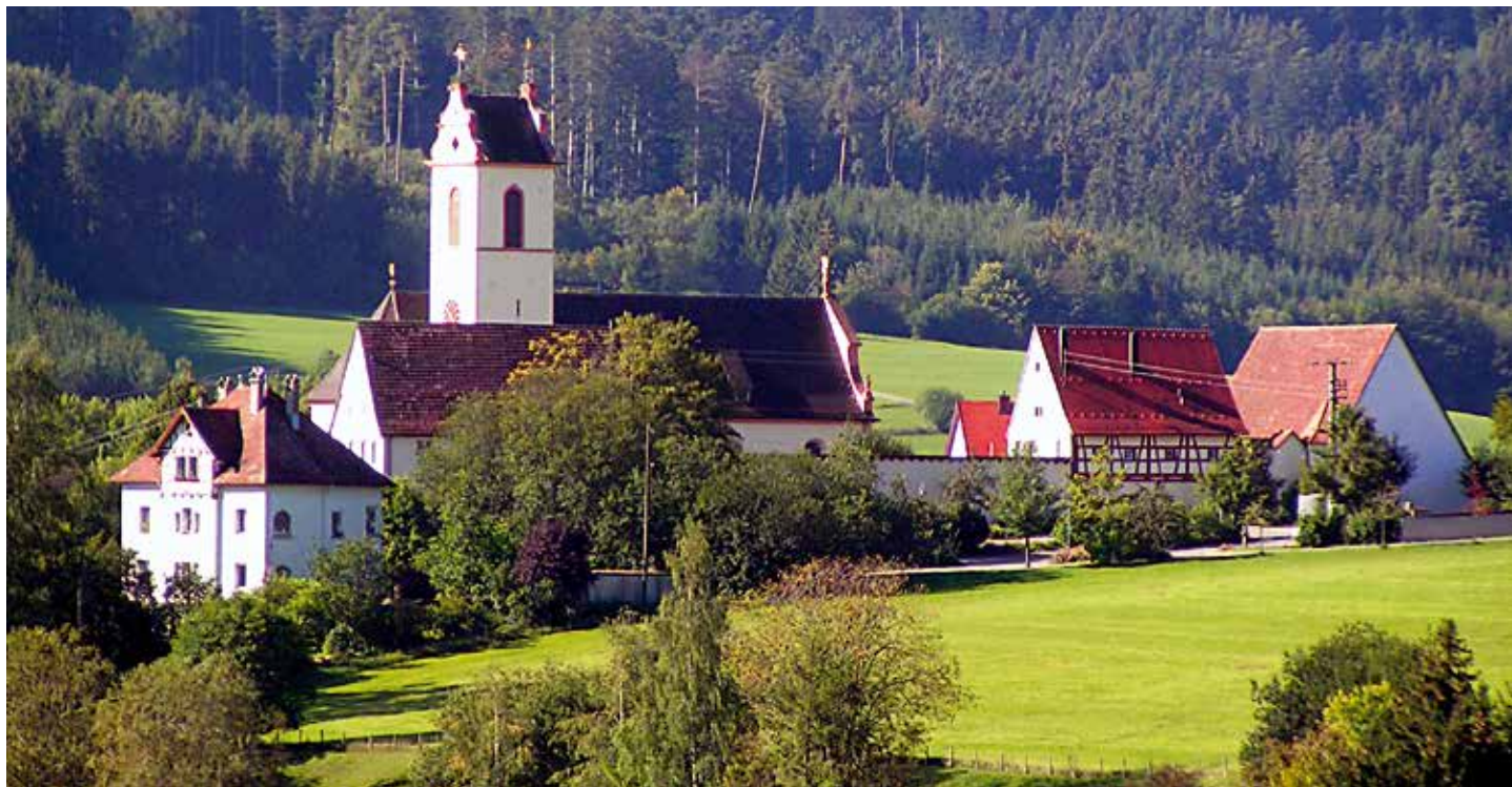
Der Kirchberg mit der Kirche Mariä Himmelfahrt.

1975 schlossen sich Seitingen und Oberflacht im Zuge der Gemeinde- und Kreisreform zur Gemeinde Seitingen-Oberflacht zusammen.