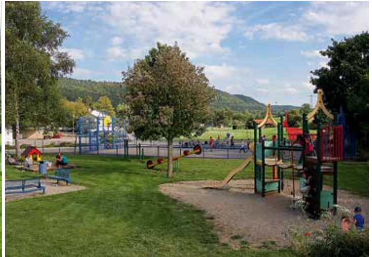
Das Sport- und Freizeitgelände Deckenhofen

Durch Dorfentwicklungsmaßnahmen in den vergangenen Jahren haben wir der Gemeinde ein schmales Aussehen gegeben. Der Kirchberg mit seiner barocken Kirche ist ein Wahrzeichen und gleichzeitig eine besondere Perle unserer Gemeinde. Auch die Eustasiuskapelle, der Hohenkarpfen sind als Sehenswürdigkeiten zu nennen.