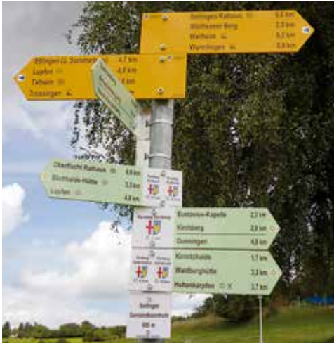
Wanderwege in und um Seitingen-Oberflacht