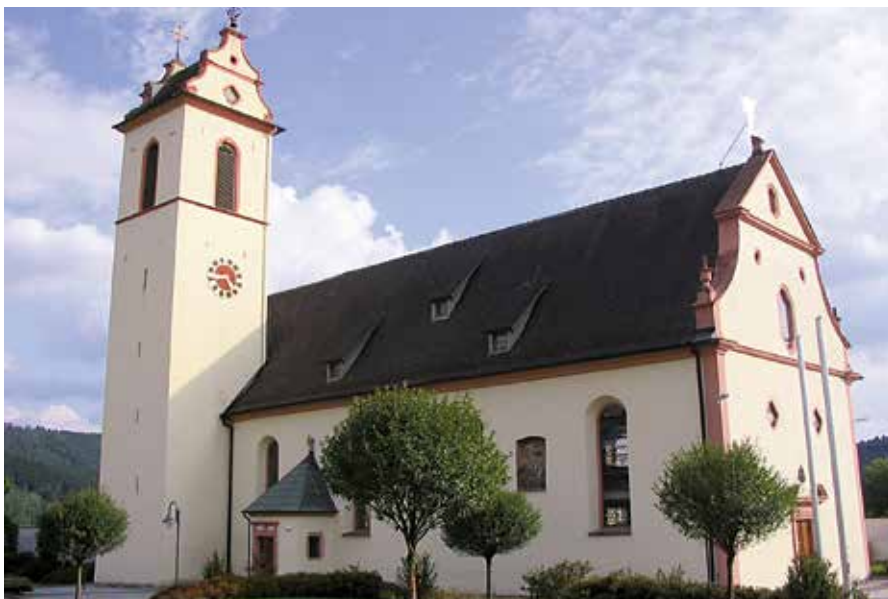
Die katholische Kirche Mariä Himmelfahrt