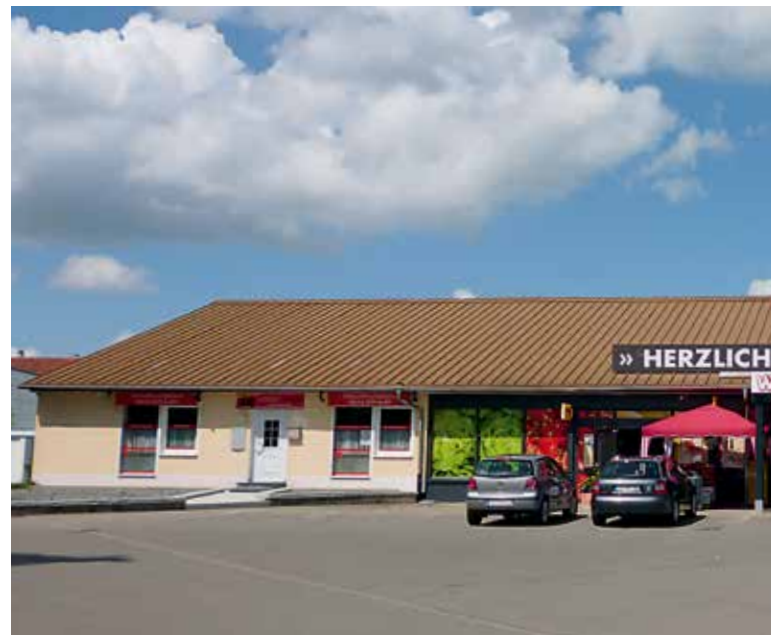
Der Einkaufsmarkt „Nahkauf“