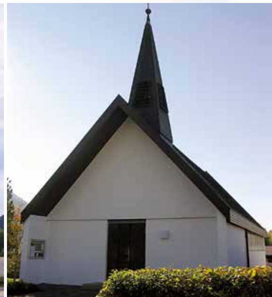
Die evangelische Lukaskapelle

Die kath. Kirchengemeinde unterhält das Gemeindehaus St. Michael mit Versammlungs- und Veranstaltungsräumen. Die kirchlichen Nachrichten werden regelmäßig im Mitteilungsblatt der Gemeinde bekannt gemacht. Seit einigen Jahren sind die Katholiken aus