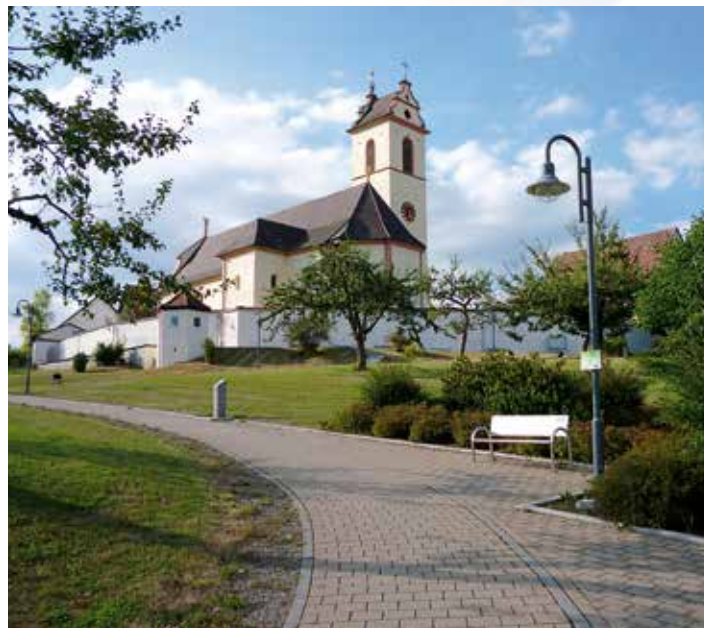
Kirchberg – Pfarrgarten – Kirche