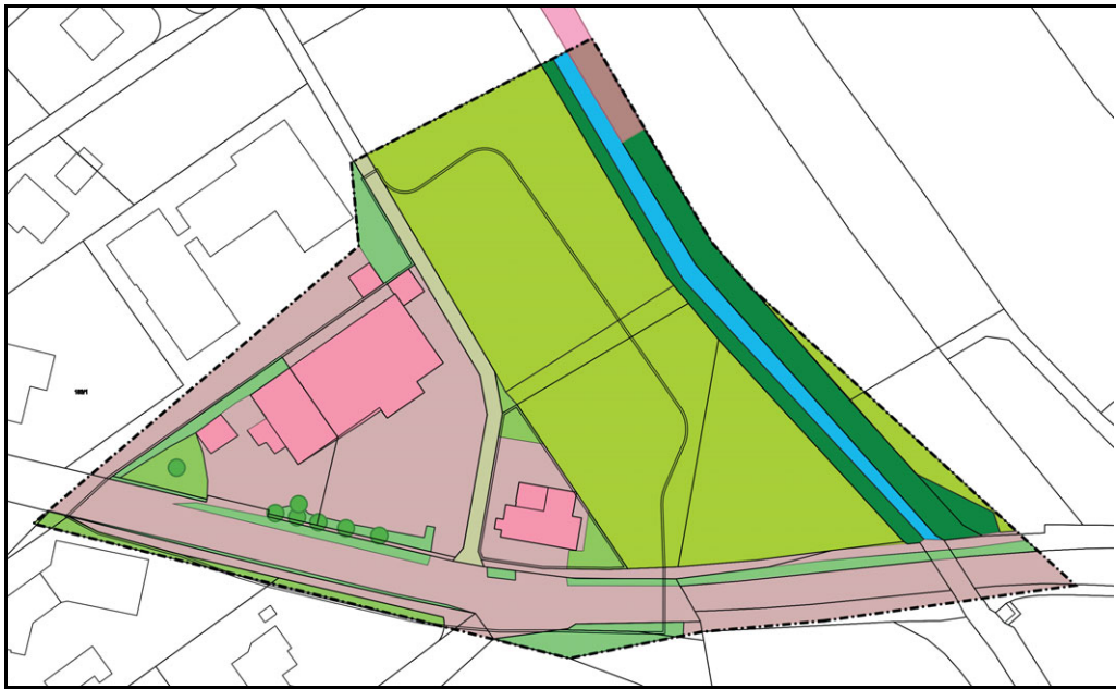
Abb. 1: Untersuchungsraum (schwarz gestrichelte Fläche) - Darstellung als Auszug der Biototypkartierung zum Umweltbericht

Der ca. 1,7 ha große Untersuchungsraum (UR) liegt teilweise im Außenbereich an der Hauptstraße beim östlichen Ortseingang von Oberflacht auf den Flurstücken Nr. 187, 187/1, 187/2, 187/3 und teilweise auf den Flurstücken Nr. 147/1 (Heerweg), 154, 157/1, 157/2, 179, 189, 189/1, 629/1, 629/2, 629/4, 194, 1913/3 und 2065 (Hauptstraße) (Abb.1). Aufgrund der Kleinräumigkeit des Vorhabens sowie seiner Lage am Ort wurde der UR auf den zukünftigen Geltungsbereich sowie dessen näheres Umfeld beschränkt.