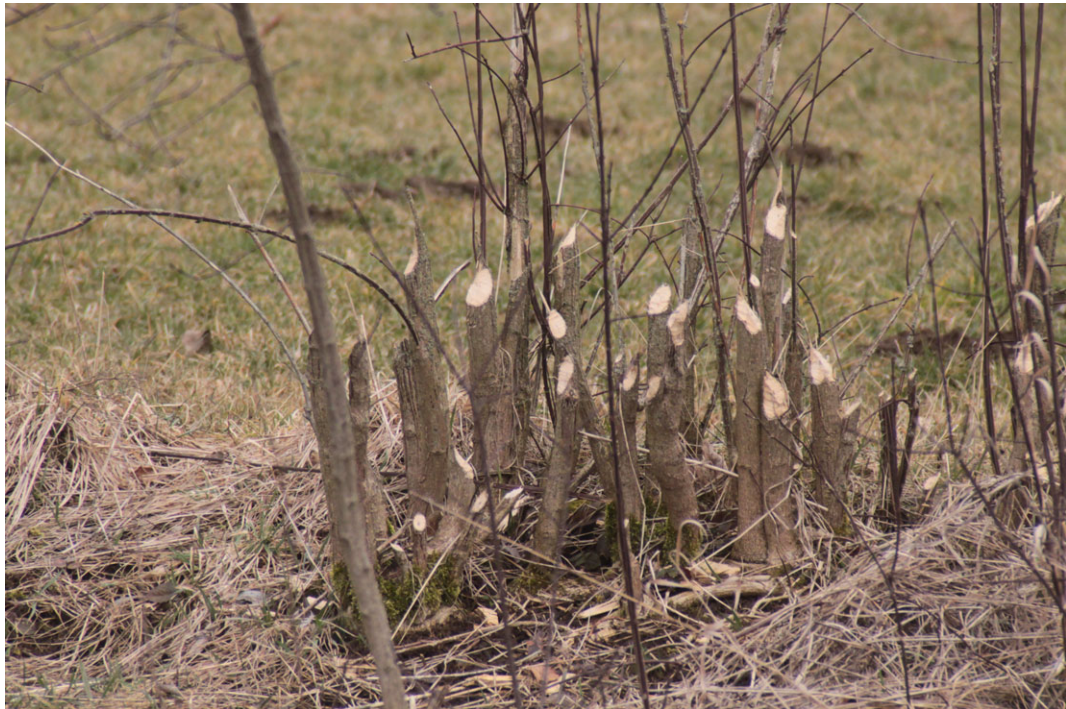
Abb. 2: Nagespuren eines Bibers an Gehölzen am Gewässerufer östlich des UR