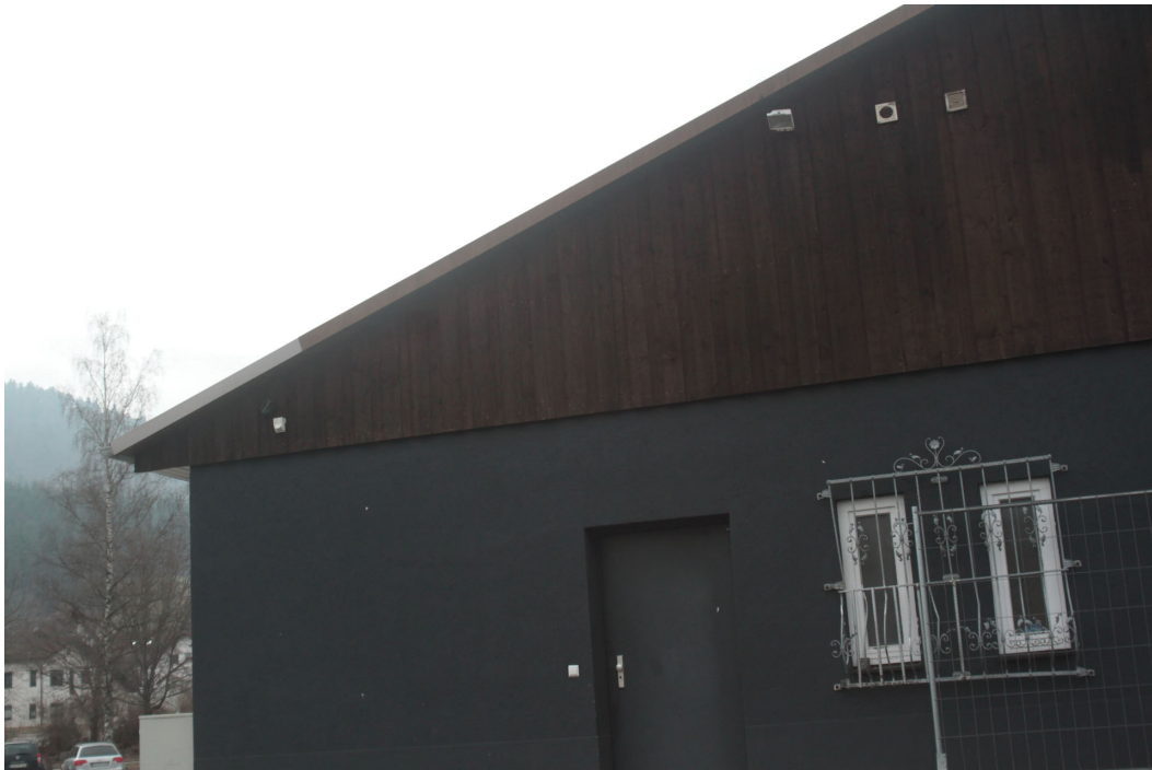
Abb. 4: Blick von Flurstück 179 auf das Dach von Gebäude 4

Alle Arten der in Deutschland vorkommenden Fledermäuse sind Arten des FFH Anhangs IV und unterliegen damit explizit dem besonderen Artenschutz nach § 44 BNatSchG. Der UR bietet durch fehlende Spaltöffnungen an den Dächern kein Habitatpotenzial für Fledermausarten (Abb. 4). Es gibt keine Leitstruktur und es konnten keine relevanten Teilhabitate ausgemacht werden.