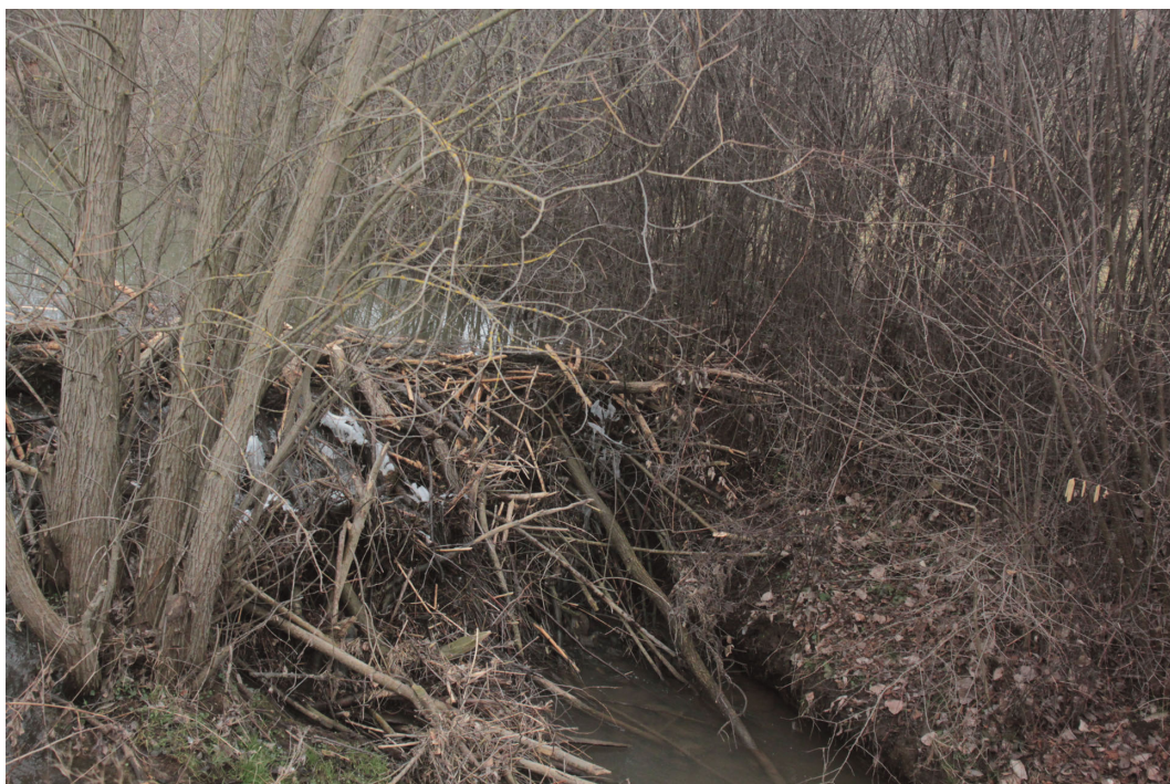
Abb. 3: Staudamm des Bibers nordöstlich des UR